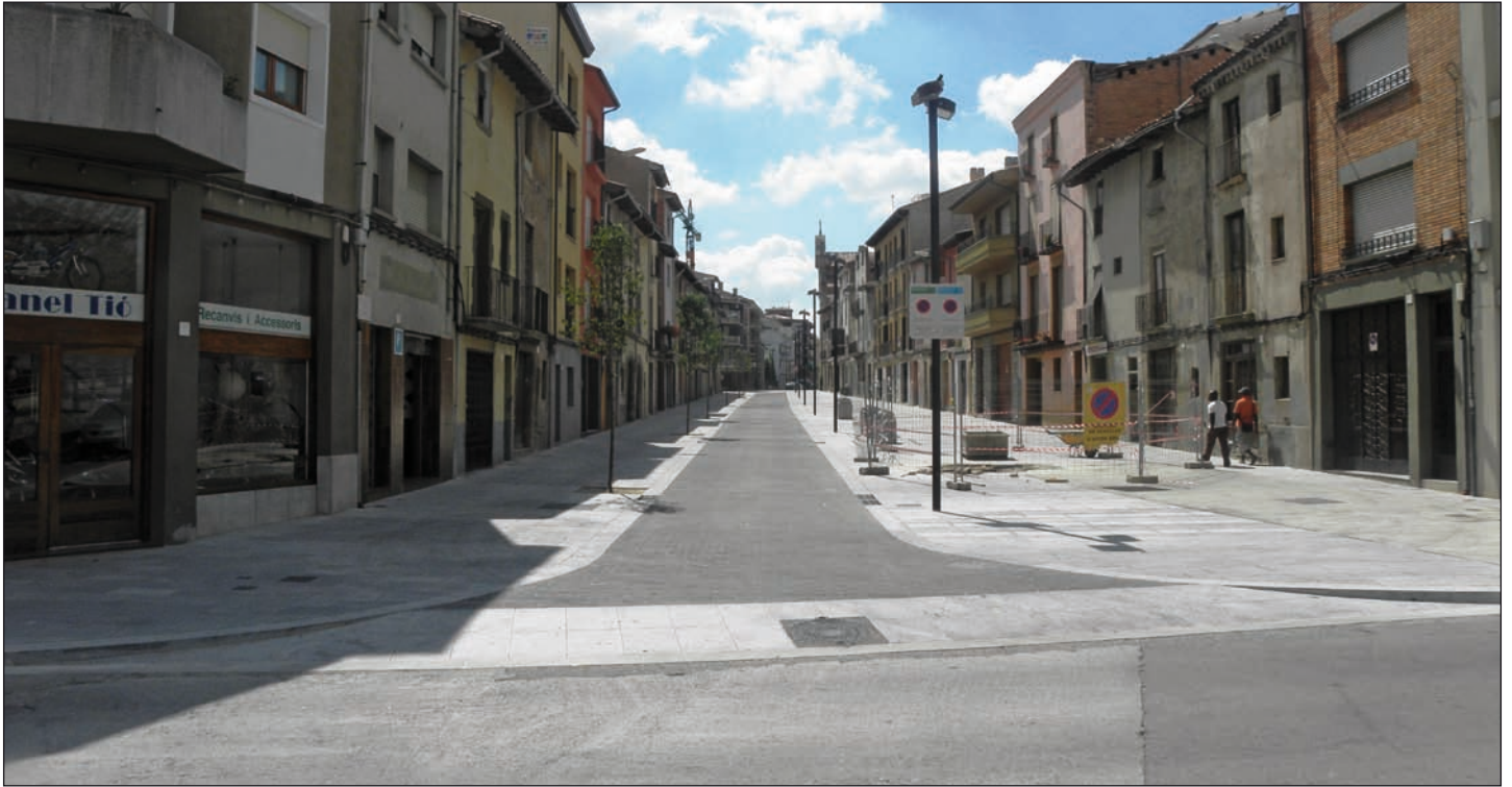
El carrer del Remei