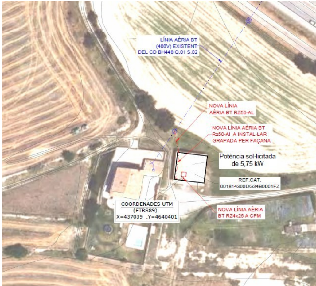
Imatge 1. Proposta realitzada per al nou subministrament.

Aquesta proposta entra en contradicció amb els següents articles del POUM: